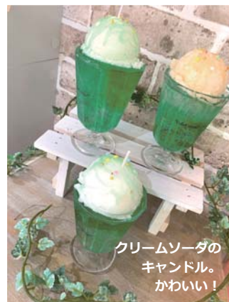
クリームソーダのキャンドル。かわいい！

I'm Homeは創建舎が編集発行するフリーペーパーです。私たち創建舎は家づくりを通して、日々の暮らしが豊かで笑顔の多い生活であることを願います。そして、環境に優しい家づくりをこれからも目指します。