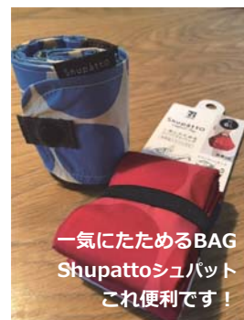
一気にたためるBAG Shupattoシュパット これ便利です！

7月1日より、有料化になったレジ袋！しかし、スーパーに行く時はマイバックの存在は忘れませんが、それ以外の買い物に出かける時についつい忘れてしまいます。最近では、レジ袋の他にもストローが紙になったりと環境が考えられる事案が増えてきました。その中で今回の有料化に変わったことにより、SNSでは様々な工夫をよく目にするようになりました。考え方1つや、1人の行動の広がりによってさまざまな案が湧き出てくる妻さを知りました。コロナウィルスにより、なんと一か一かギスギスした世の中ですが、楽しい事を自分で見つけられたらハッピーなのかな…と思うこのごろです。上野