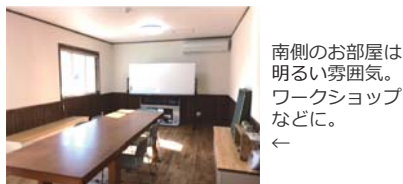
南側のお部屋は明るい雰囲気。ワークショップなどに。

創建舎事務所内にあるレンタルスペース『Dröm』デュロムは、スウェーデン語で“夢”を意味する言葉。夢のある生き方のお手伝いを…。そんな思いから地域貢献の場としてギャラリーをお貸し出ししております。ワークショップやカルチャースクール等に是非ご利用下さい。ご利用の内容によってはお断りする場合もございます。ご興味のある方は、一度見学にお越しください。商品の販売を伴う会員勧誘などのセミナーはご利用できません。まずは、お気軽にお電話ください。ご利用お待ちしております。 ¥1,000/1部屋1日(平日のみ)