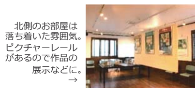
北側のお部屋は落ち着いた雰囲気。ピクチャーレールがあるので作品の展示などに。