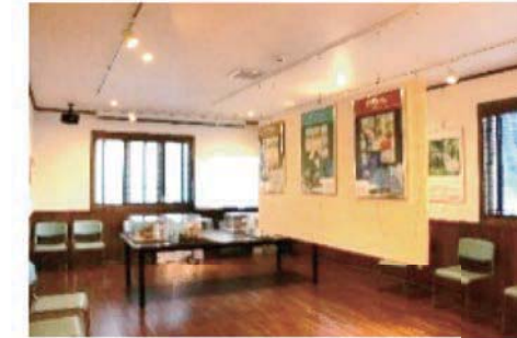
ピクチャレールのあるお部屋 落ち着いた雰囲気です。