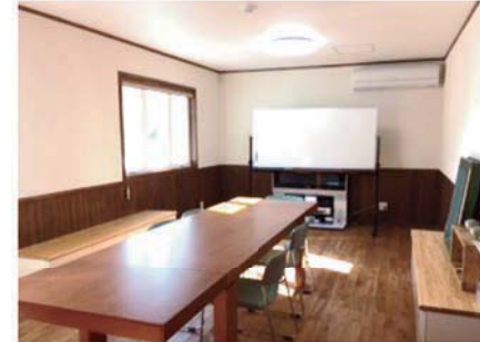
南側のお部屋は明るい雰囲気