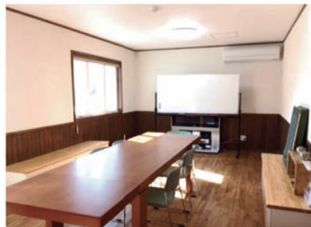
南側のお部屋は明るい雰囲気

創建舎事務所内にあるレンタルスペース『Dröm』スウェーデン語で“夢”を意味する言葉。夢のある生き方のお手伝いを…。そんな思いから地域貢献の場としてギャラリーをお貸ししております。ご利用の内容によってはお断りする場合がございます。ご興味のある方は、一度見学にお越しくださいませ。まずは、お気軽にお電話ください。ご利用お待ちしております。 ¥500/1部屋1日(平日のみ)