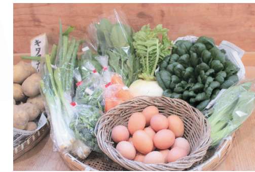
人気の有精卵や有機栽培の野菜

レストランからの要望で作り始めたそう実がなるまで3~4年かかるそうです。まだ実がないのに、ハウスの中は柑橘系の香りがします!!