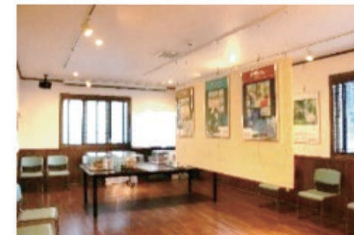
ピクチャレールのあるお部屋 落ち着いた雰囲気です。