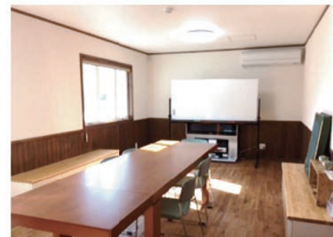
南側のお部屋は明るい雰囲気