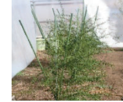
フィンガーライムの木

レストランからの要望で作り始めたそう実がなるまで3~4年かかるそうです。まだ実がないのに、ハウスの中は柑橘系の香りがします!!