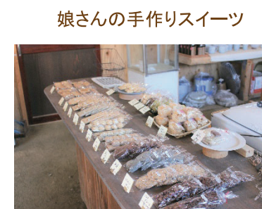
娘さんの手作りスイーツ

国産小麦を使用し、ナッツ類やドライフルーツは外国産でもオーガニックなものを使用。15種類のマフィンやクッキーがきれいにラッピングされ販売されています。